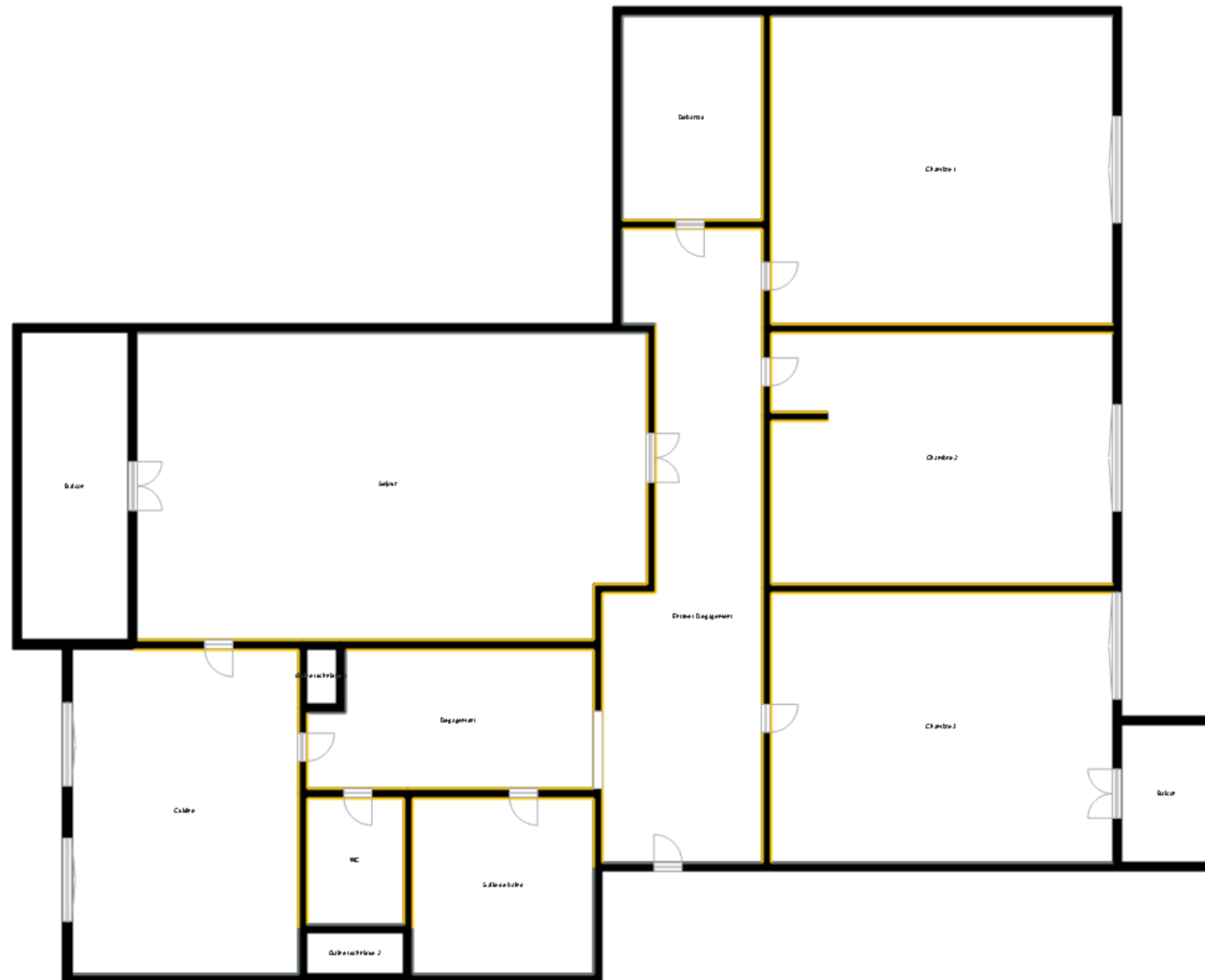
PLANCHE DE REPERAGE

Bien : 447LBA0102 - 418 3 RUE HENRI GUILLAUMET 77400 LAGNY SUR MARNE